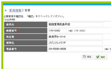
薬局データの登録